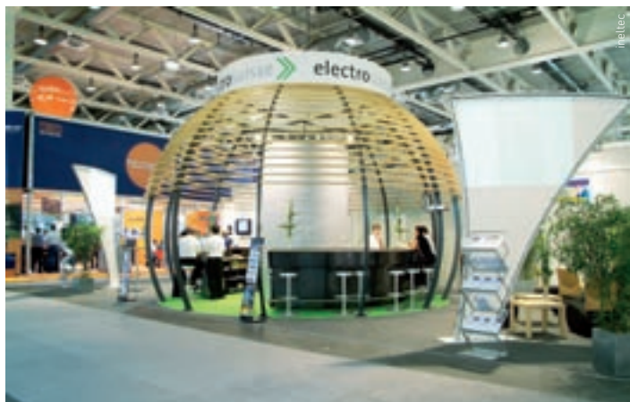
Auch dieses Jahr sind an der «ineltec» nahezu alle wichtigen Key-Player wieder vertreten.

Trotz Wirtschaftskrise haben sich bis heute über 200 Aussteller entschieden, am wichtigsten Branchentreffpunkt für Gebäudetechnik und Infrastruktur teilzunehmen. An der «ineltec» präsentieren sie Anfang September 2009 in Basel attraktive und innovative Produkte und Dienstleistungen.