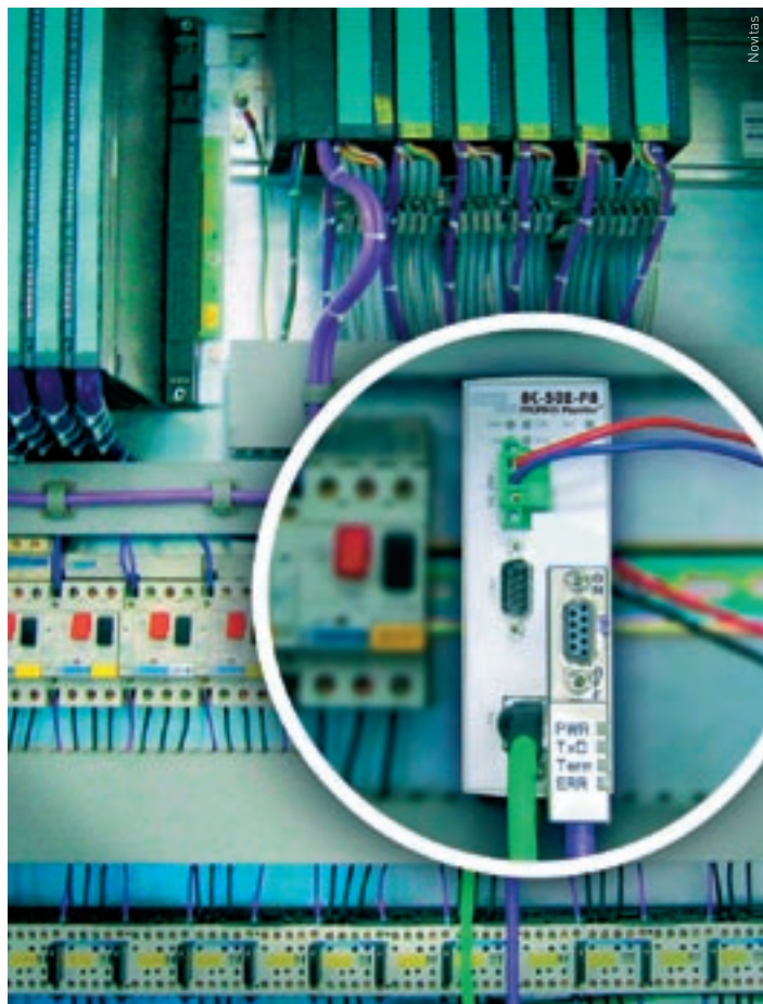
Der Profibus-Inspektor überwacht permanent den gesamten Datenverkehr auf dem Bus.

Die Tatsache, dass Feldbusse sehr stabil arbeiten, verleitet oft zur Sorglosigkeit. Dabei hängt die Verfügbarkeit ganzer industrieller Anlagen wesentlich vom Wohl eines Feldbussystems ab. Moderne Diagnose-Tools ermöglichen deshalb vorbeugende Prüfungen. Ein neuartiges Gerät macht nun sogar eine zustandsbedingte Wartungsstrategie möglich: maximale Anlagenverfügbarkeit bei minimalen Instandhaltungskosten.