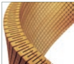
TITELBILD Aus der Reportage «Die neuen Materialien», Seite 9.

IMPRESSUM «BAU & ARCHITEKTUR», eine Sonderpublikation von «SWISS ENGINEERING STZ», dem offiziellen Organ von Swiss Engineering STV, www.swissengineering-stz.ch, 7. Jahrgang, erscheint fünfmal im Jahr HERAUSGEBER Künzler-Bachmann Medien AG, 9001 St.Gallen, und STV-Verlags AG, 8023 Zürich. REDAKTION Sigrid Hanke, Chefredaktorin, Feldeggstrasse 89, 8008 Zürich, Tel. 043 499 99 01, Fax 043 499 99 31, E-Mail: sigrid.hanke@bluewin.ch, Christa Rosatzin-Strobel, Sprachwerk, Technoparkstrasse 1, 8005 Zürich, Tel. 044 445 19 91, kontakt@sprachwerk.ch VERLAG KünzlerBachmann Medien AG, 9001 St.Gallen, www.kbmedien.ch, Roland Köhler, Nicola Montemarano, Verlagsleitung ANZEIGENMARKETING KünzlerBachmann Medien AG, 9001 St.Gallen, Tel. 071 226 92 92, Fax 071 226 92 93 ABONNEMENTE KünzlerBachmann Medien AG, abo@kbmedien.ch, Tel. 071 226 92 92 GRAFISCHES KONZEPT Neuhaus Werbung, 8565 Hugelshofen LAYOUT/PRE-PRESS KOViKOM AG, Daniel Eugster, Seewiesstrasse 9, 9403 Goldach DRUCK UND AUSTRÜSTUNG AVD Goldach, Sulzstrasse 10, 9403 Goldach, Tel. 071 844 94 44. Nachdruck von Texten nur mit Zustimmung der Redaktion und Quellenangabe gestattet. ISSN 1660-0312.