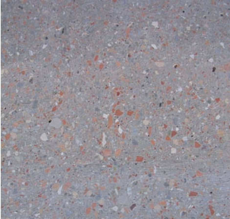
Das Schleifen der Oberfläche fördert ein einmaliges Materialbild zu Tage.

und in den Backofen geschoben. Der Teig geht bei 700 Grad auf und wird bei 950 Grad ausgebacken. Dabei entsteht ein höchstporöses Material, das jedoch durch seine fachwerkartige Struktur und die extreme Porendichte eine ausserordentlich hohe Druckfestigkeit erreicht. Ausserdem ergibt die grosse Menge eingeschlossener Luft einen sehr guten Dämmwert. Immer häufiger kommt Misapor auch beim Hausbau zum Einsatz. Misapor-Beton, der zu rund sechzig Prozent aus Altglas besteht, hat einen so guten Dämmwert, dass es keine Isolation