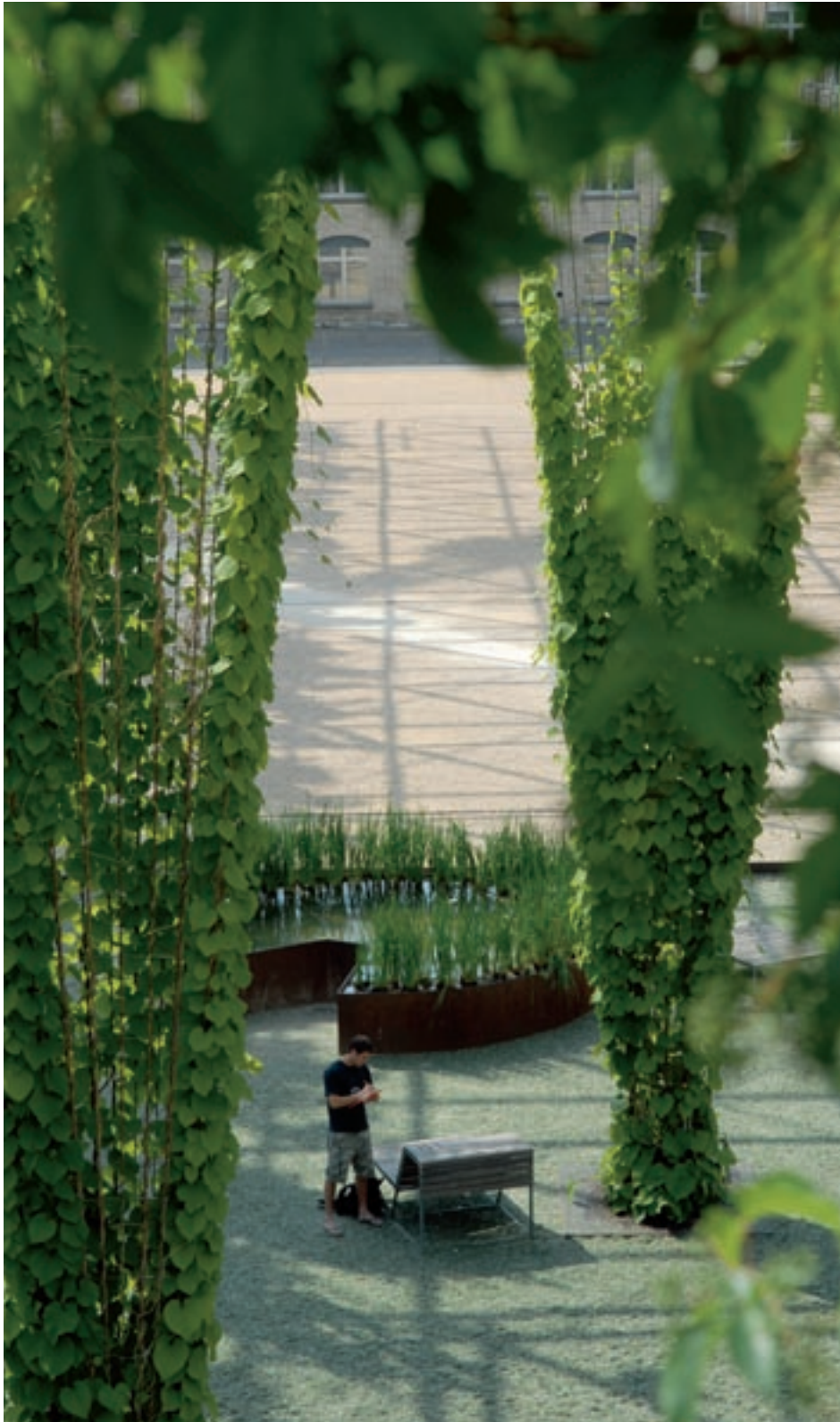
Ob Glas oder Beton – Recyceln ist en vogue.

Der Einsatz von Recyclingmaterialien im Bau ist ökologisch nachhaltig. Ressourcenverknappung und damit verbunden das Thema des Rückbaus beim Abbruch ist ein Gebot der Stunde. Aber auch optische Aspekte spielen beim Recyclingmaterial eine wesentliche Rolle.