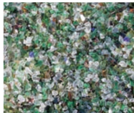
Aus der leeren Weinflasche wird hochwertiger Glasschotter hergestellt.

Nicht mehr glitzernd aber dafür wärmetechnisch höchst effizient ist die Anwendung des Altglases, wenn es als Schaumglas weiterverwendet wird. Führend in der Schaumglasherstellung ist die Firma Misapor mit Hauptsitz in Landquart. Die Herstellung von Misapor erfolgt in Surava, einer Gemeinde im Herzen Graubündens und in Dagmersellen im Kanton Luzern. Die Glasscherben werden in diesen Werken zu feinem Glasmehl zermahlen. Das Mehl wird dann mit einem anorganischen Blähmittel gemischt