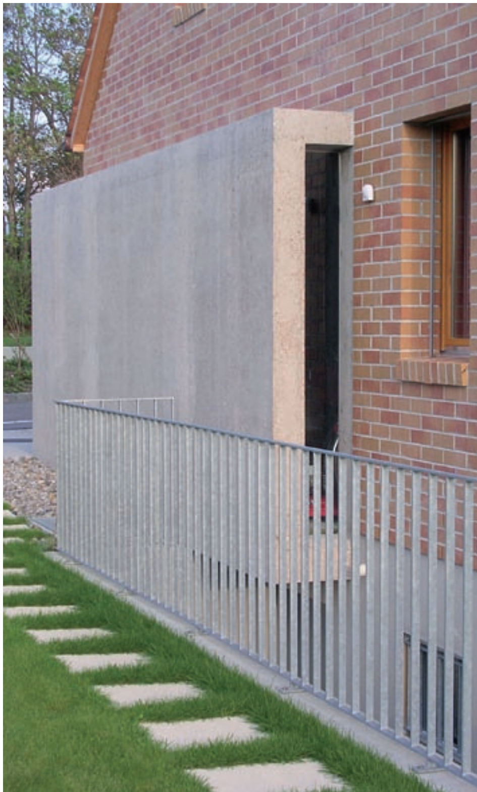
Mischabbruchbeton ist auch statisch einwandfrei verwendbar.

schiedliche Bindmittelleimvolumen zurückzuführen. Bei einer ökologisch und ökonomisch vertretbaren Zementdosierung und der Verwendung von hundert Prozent Mischabbruchgranulat wurden jedoch für normale Bauten völlig ausreichende Druckfestigkeiten von bis zu 40N/mm 2 erreicht. Der Mischabbruchbeton ist also ohne Bedenken im Hochbau einsetzbar.