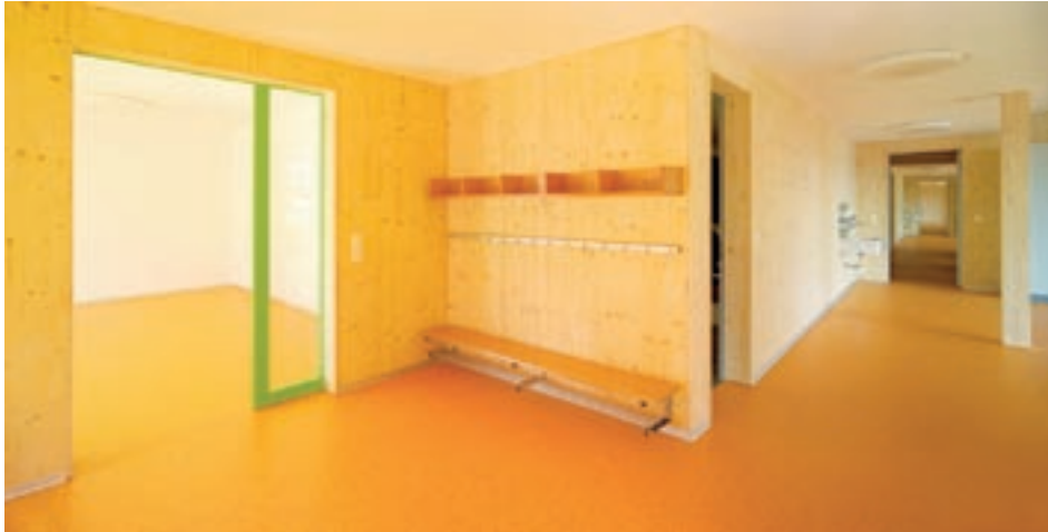
Die Holzwände innen wurden mit 3-Schichtplatten ausgeführt und unbehandelt gelassen.