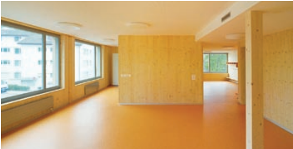
Um den Schall zu dämmen, verbergen sich hinter den Decken Schafwollmatten.

onen geprüft wurden. (Formaldehyd gilt als krebserregend und kann bei Menschen zu Allergien und Atemwegreizungen führen). Aus den Ergebnissen liess sich der zu erwartende Formaldehydgehalt in der Raumluft berechnen. Um den zu optimieren, wurden Schafwollmatten in die Holzdecke eingelegt. (Schafwolle hat die Eigenschaft Formaldehyd anzulagern und diese irreversibel chemisch zu binden.) Von den Baubiologen geprüft wurde auch das Konzept der Lüftungsanlage sowie weitere Arbeiten im Innenraum. Konkret wurden – vorab anhand der Ausschreibung, später dann auch laufend auf der Baustelle – die