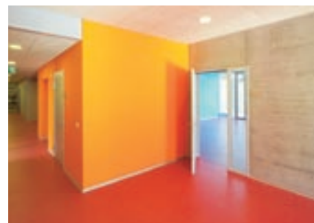
Heruntergehängte Decke mit Gipsfaserplatten.

Die Planungsleistung auf dem Weg zu einem guten Innenraumklima beinhaltet in diesem Fall als Erstes die Prüfung der Holzbaukonstruktionen. Das Hauptaugenmerk legten die Bauökologen auf die unverkleidete 3-Schicht-Platte der Wandkonstruktionen, die vorgängig auf ihre Formaldehyd-Emissi-