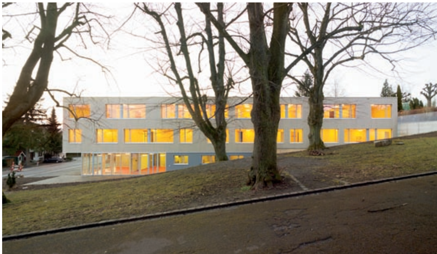
Das dreigeschossige Gebäude liegt eingebettet in ein ruhiges Wohnquartier in Wallisellen.

Die ökologische Bauweise macht es möglich: der Neubau der Tagesbetreuung «Arche», seit Frühling 2009 im Betrieb, ist als erstes Holzgebäude mit dem Label GI Gutes Innenraumklima ausgezeichnet worden. Das Gebäude setzt schweizweit einen Akzent im modernen Holzbau und überzeugt durch eine angenehme Architektur und Raum-Atmosphäre.