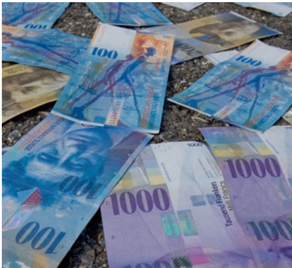
Der Entzug von Mitteln von der Strasse für die Schiene macht wenig Sinn.

Verkehrsnetze sind zentrale Elemente unserer Gesellschaft. Moderne Volkswirtschaften sind ohne gute Verkehrsinfrastrukturen nicht funktionsfähig. Beim öffentlichen Verkehr stellen wir eine rasante Entwicklung der Bedürfnisse fest.