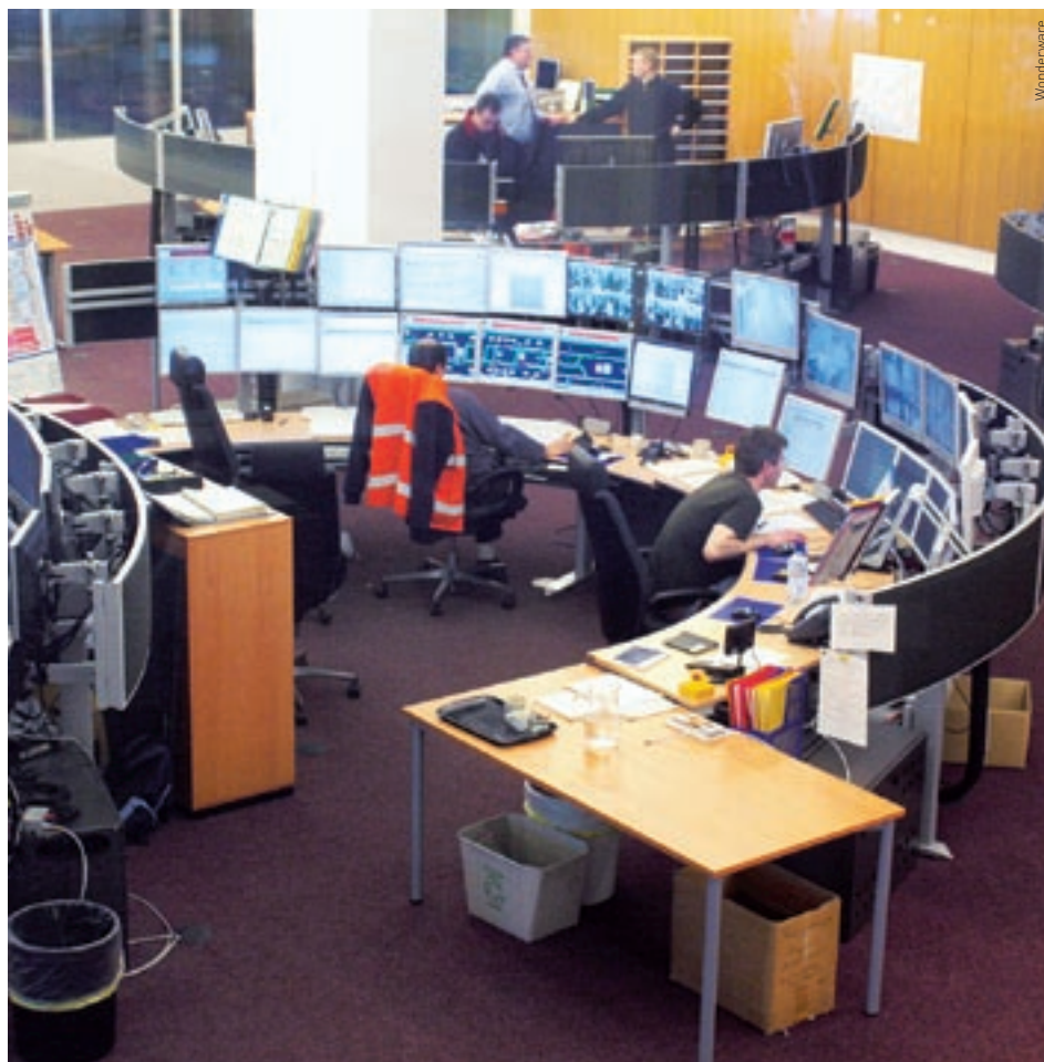
Die Überwachung der Fernsteuerung der U-Bahnlinie garantiert das reibungslose Funktionieren des gesamten Systems.

Die Métro 1 ist eine leichte, eingleisige Stadtbahn mit Perrons auf Bodenniveau der Wagen. Sie bildet das Rückgrat des öffentlichen Nahverkehrs im Südwesten von Lausanne. Diese Bahn verbindet das Stadtzentrum mit dem Vorort Renens und bindet dabei den Hochschulcampus mit ein. Nun wurde die Betriebsleitung der Métro an einem Ort zentralisiert.