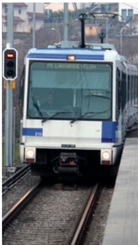
Die Métro ist eine leichte, eingleisige Stadtbahn im Südwesten von Lausanne.

Diese Software dient zur Abfrage von Alarmen und Events innerhalb des Systems und zu ihrer Speicherung auf dem Datenbank-Server.