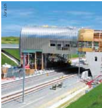
Chantier du TGV dans le secteur de Meroux-Moval.

Ce sera fait, enfin ! Le 11 décembre prochain, une nouvelle gare pour le TGV sera inaugurée à quelques kilomètres de la frontière jurassienne de Boncourt. Les trains mettront alors 2h20 pour rejoindre Paris. En 2013 sera réouverte la ligne régionale entre Delle et la nouvelle gare TGV. Cette année, de nouveaux tronçons de l'A16 ont été mis en service, pour une ouverture complète entre Bienne et Boncourt agendée en 2016. Tenant compte également de la présence d'un aéroport international (Bâle-Mulhouse) à proximité et du projet d'autoroute Delémont-Bâle, le Jura sera dès lors positionné au cœur de l'Europe, facilement accessible par la route, le rail et les airs.