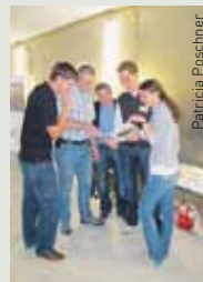
Un intérêt partagé.

de la politique et des associations. Cette manifestation, mise sur pied par SwissICT, la Haute Ecole de Lucerne ainsi que le GRID Lucerne, est l'un des événements marquants de l'année en matière de technologie de l'information et de la communication.