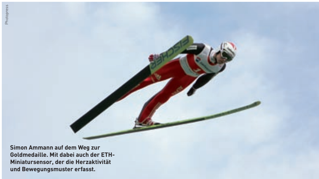
Simon Ammann auf dem Weg zur Goldmedaille. Mit dabei auch der ETH-Miniatursensor, der die Herzaktivität und Bewegungsmuster erfasst.

Die ETH Zürich war buchstäblich hautnah dabei, als Simon Ammann bei den Olympischen Winterspielen in Vancouver zweimal zur Goldmedaille flog: Ein an dessen Körper befestigter Miniatursensor lieferte ETH-Doktoranden wertvolle Informationen über den mentalen Zustand des Skisprung-Königs.