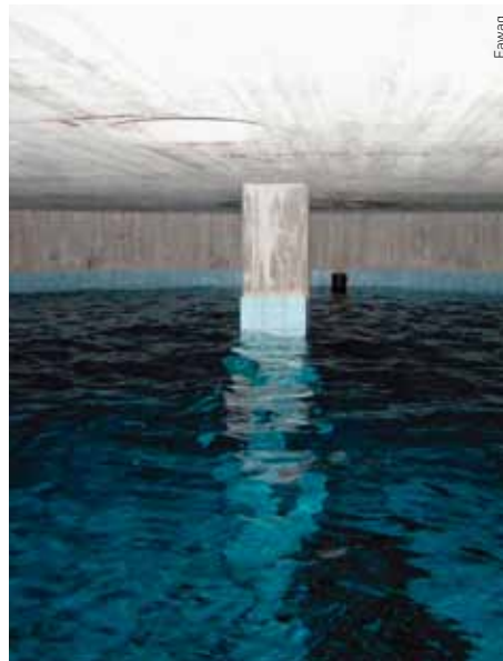
Reservoir in Gordola.

Was tun, wenn die Wasserversorgung erneuert werden muss? Vor dieser Frage steht wohl auch die eine oder andere Schweizer Gemeinde. Denn die Wasserinfrastruktur kommt langsam in die Jahre oder ist falsch dimensioniert. Die Gemeinde Gordola hat gezeigt, wie es gehen könnte.