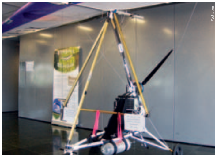
Der Leichtflieger mit Brennstoffzellenantrieb überquerte 2009 den Kanal nach England.

Ungebrochen ist die Faszination über die Chancen der Brennstoffzelle als direkter Energiewandler für unterschiedliche Einsatzgebiete. Materialtechnische und energiepolitische Hindernisse erschweren aber nach wie vor den breiten Einsatz. Nischenprodukte hingegen haben schon heute Erfolg.