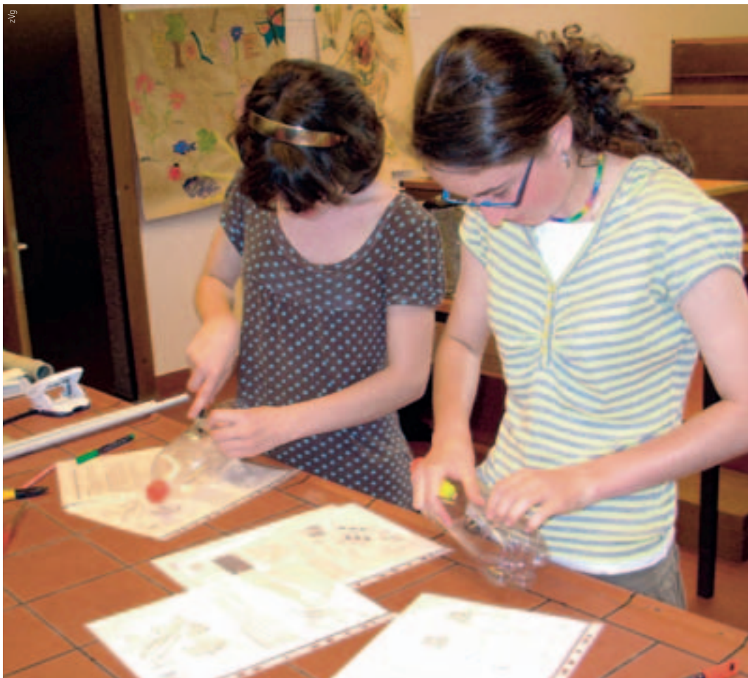
Das frühe Interesse an Mathematik und Naturwissenschaften ist entscheidend für die spätere Ausbildung zu einer MINT-Fachkraft.

die das langfristige Wachstum bedrohen kann.