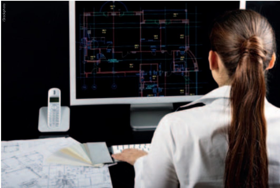
Vor allem Frauen sollen vermehrt für technische Berufe begeistert werden, damit die Fachkräftelücke geschlossen werden kann.

Technik nimmt heute eine bedeutende Position ein. Einerseits zeichnet sich die Generation der Digital Natives durch eine hohe Technikaffinität aus. Andererseits fehlt es auf dem Arbeitsmarkt an fachkundigen Ingenieuren und Informatikern. Eines ist sicher: Junge, gut ausgebildete Fachkräfte sind heiss begehrt.