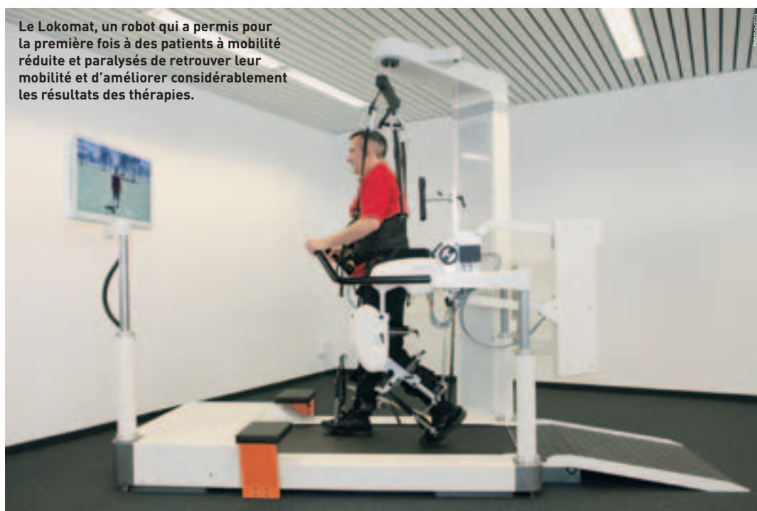
Le Lokomat, un robot qui a permis pour la première fois à des patients à mobilité réduite et paralysés de retrouver leur mobilité et d'améliorer considérablement les résultats des thérapies.

Des appareils qui aident les patients atteints de troubles neurologiques à retrouver leur mobilité, un jeu vidéo qui soulage les douleurs dans le dos : ces concepts qui paraissent pour l'instant futuristes sont développés et produits par la société suisse Hocoma depuis une dizaine d'années. Le leader mondial dans la fabrication d'appareils de thérapie automatisés emploie aujourd'hui 130 collaborateurs en Suisse ainsi que dans les succursales aux Etats-Unis et à Singapour. Elle vend ses produits dans plus de 50 pays à travers le monde.